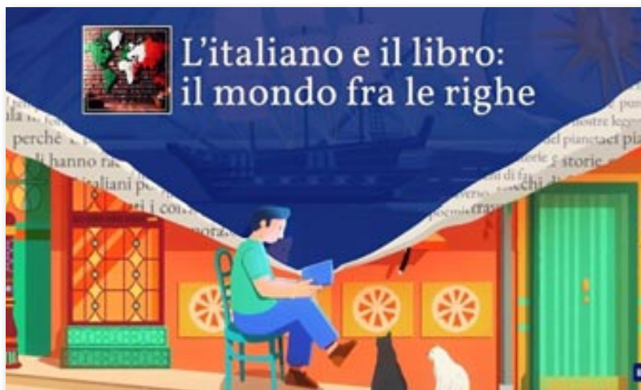
figura come lingua ufficiale nel quadro del plurilinguismo costituzionale elvetico, sono state realizzate svariate iniziative ed eventi durante i giorni della SLIM.