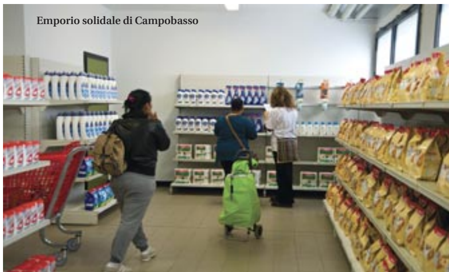
Emporio solidale di Campobasso