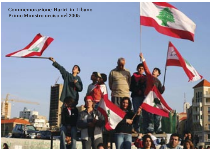
Commemorazione-Hariri-in-Libano Primo Ministro ucciso nel 2005

pur troppo Unifil non ha (e dovrebbe avere, per quello che si è detto) tra le sue regole d'ingaggio la capacità di disarmare Hezbollah.